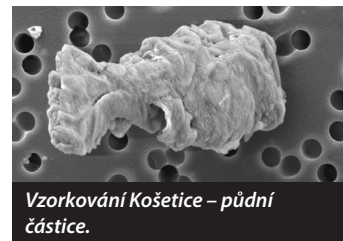
Vzorkování Košetice – půdní částice.