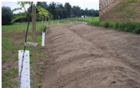
Práce na terénní vlně a konečná úprava s výsadbou stromů a keřů.

Možná jste si všimli nové výsadby, která „vyrostla“ nad obcí v kopci nad Zadražilovými. Tato terénní vlna spolu s výsadbou stromů a keřů by měla sloužit k rozčlenění krajiny a prudkého svahu při silných deštích a také časem jako remízky pro úkryt drobné zvěře. Terénní vlna a dále výstavba záchytných žlabů v poli nad Tomšovými a za „Závodovými“ byla plánována jako protierozní opatření již v pozemkových úpravách. Letos na jaře došlo na jejich realizaci a Pozemkový úřad Pelhřimov zorganizoval a zaplatil v rámci pozemkových úprav veškeré stavební a výsadbové práce v celkové hodnotě cca 350 tis. Kč. Upravené pozemky předal do majetku obce Moraveč.